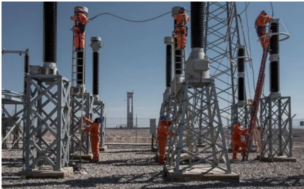
Imagen de la planta termo solar Cerro Dominador, de la empresa de inversiones estadounidense EIG Global Energy Partners . Primer plano: subestación similar a las usadas por las demás termoeléctricas solares y parques fotovoltaicos y eólicos, que eleva la tensión a 220 kV para conectarse a la red. Al fondo: la torre que desde los paneles solares concentra el calor que almacena la sal solar para producir el vapor que mueve la turbina generadora de electricidad. 31/03/2017.

En breve, esta estrategia asesorada por McKinsey propone un negocio a gran escala destinado básicamente a exportar energía generada a partir de las llamadas “fuentes renovables”. En la práctica, se trata de maquillar con el barniz de hidrógeno verde (H2V) a industrias de electricidad, petróleo y gas, mineras, forestales y otras, que además seguirán usando combustibles fósiles, destruyendo el medioambiente y contaminando igual o más que antes. El plan omite establecer, por ejemplo, los daños a la naturaleza y a las personas, las cantidades de agua utilizada y los gases causantes de efecto invernadero que se pueden escapar de los mencionados proyectos de energía, tanto o más nocivos para la atmósfera que el metano o el dióxido de carbono (CO2), como son el óxido nitroso (N2O) en las centrales termo solares y hexafluoruro de azufre (SF6) en las subestaciones eléctricas [4].